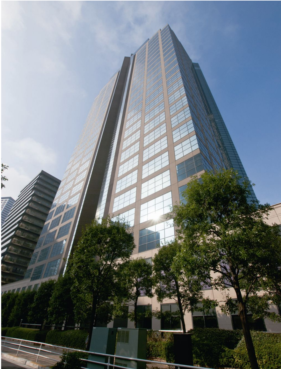
【参考資料3】本物件の外観写真